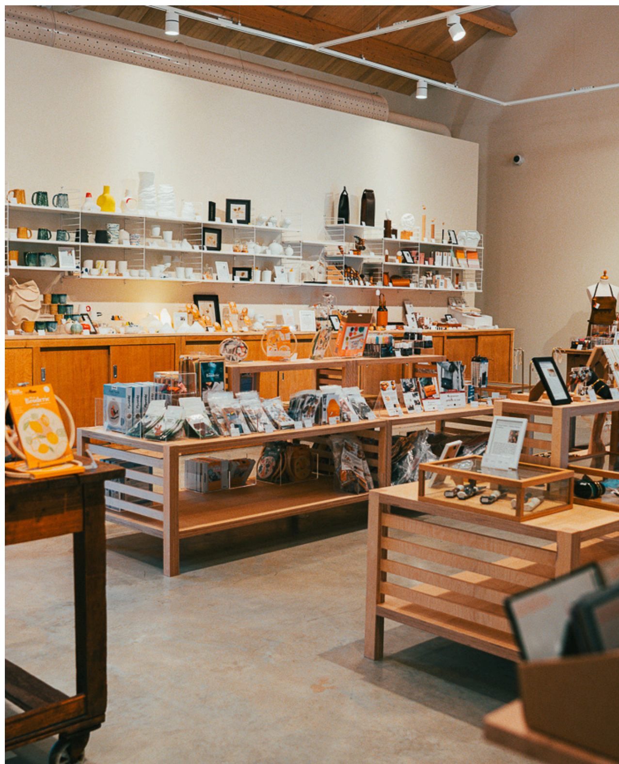
PHOTO DE LA BOUTIQUE